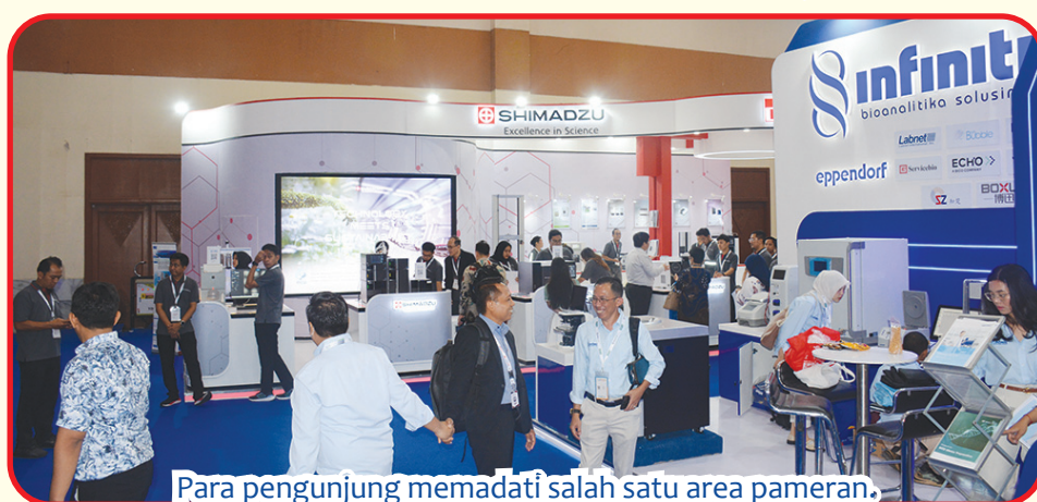
Para pengunjung memadati salah satu area pameran.

Kemudian seluruh yang hadir, saling bersalaman dan maaf memaafkan. Dan diakhiri dengan ramah tamah. • anto tze