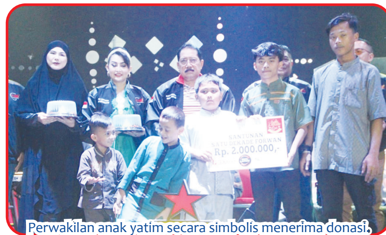
Perwakilan anak yatim secara simbolis menerima donasi.

JAKARTA (IM) - Keluarga besar Forwan (Forum Wartawan Hiburan) menggelar tasyakuran satu decade sekaligus halal bihalal, di Waroeng Rakyat Noesantara, Jalan Kranggan Permai, Jakasampurna, Bekasi, Minggu (21/04).