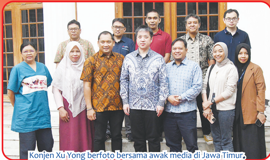
Konjen Xu Yong berfoto bersama awak media di Jawa Timur.