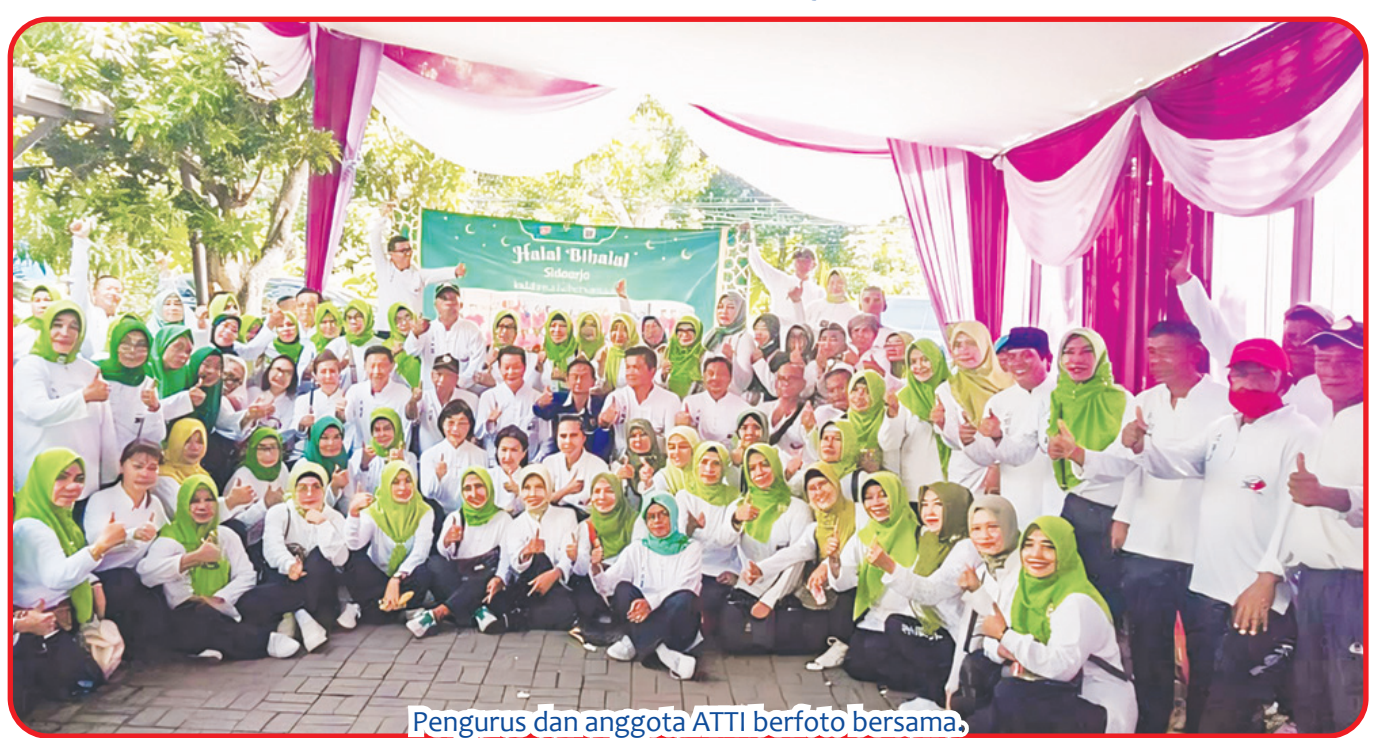
Pengurus dan anggota ATTI berfoto bersama.