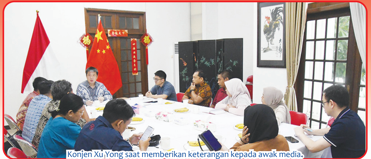
Konjen Xu Yong saat memberikan keterangan kepada awak media.

SURABAYA (IM) - Konsulat Jenderal Republik Rakyat Tiongkok di Surabaya Xu Yong, Senin (22/4) lalu menggelar hal-hal dengan sejumlah media di Jawa Timur.