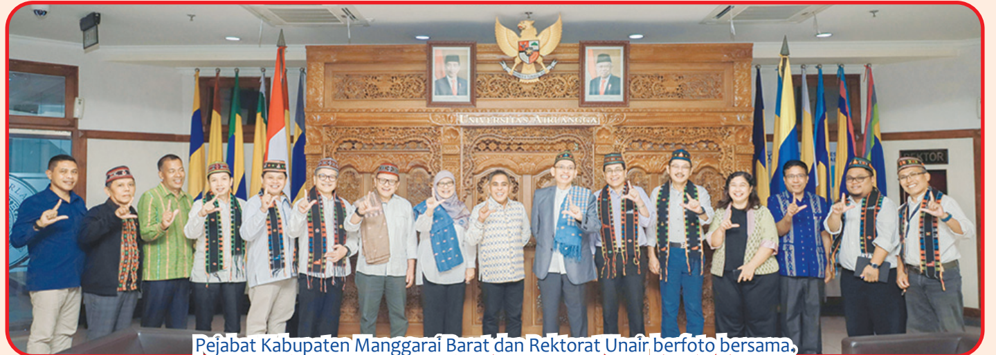
Pejabat Kabupaten Manggarai Barat dan Rektorat Unair berfoto bersama.

SURABAYA (IM) - Pemerintah Kabupaten (Pemkab) Manggarai Barat melakukan penandatanganan MoU (Kesepakatan Bersama) dengan Unair (Universitas Airlangga), Jumat (19/4).